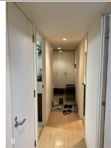
リフォーム前またはリフォーム後の写真 (どちらでも構いません)