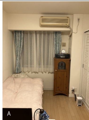
リフォーム前の写真