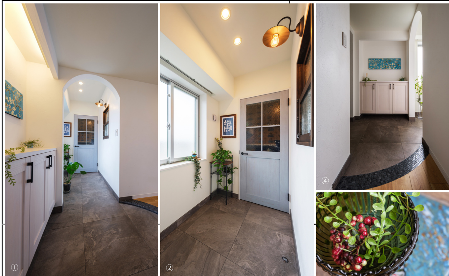
リフォーム後の写真 (作品テーマ、工事内容が明確に分る内容の写真。写真4枚程度)